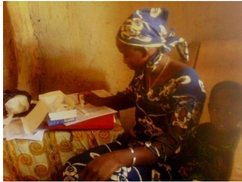
Un ASC réalisant un test de dépistage du paludisme chez un enfant de moins de 5 ans.