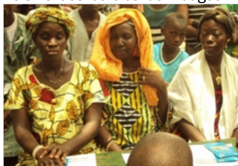
Des femmes au lancement d'une CVSS à N'djifina/wacoro

consultations curatives et prénatales, les accouchements, les actes de petite chirurgie et les médicaments. Son lancement, moment d'intense ferveur a réuni les habitants de la commune et des villages voisins des cercles de Bougouni