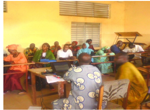
Séance de formation des ASC.