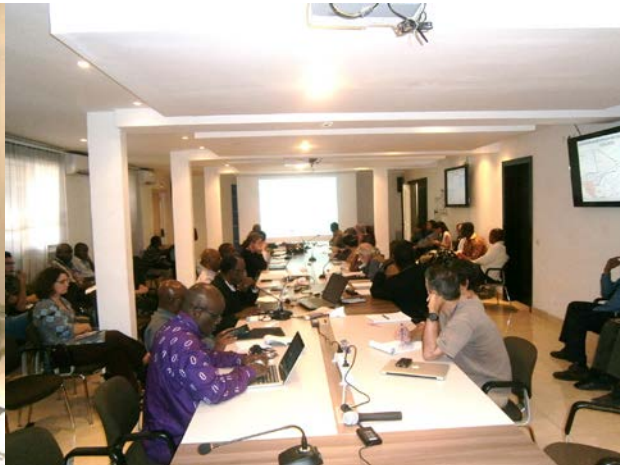
Vue de la réunion de la Task Force des partenaires Ebola du 15 janvier 2015

La carte ci-dessous renseigne sur la localisation des cas confirmés et probables.