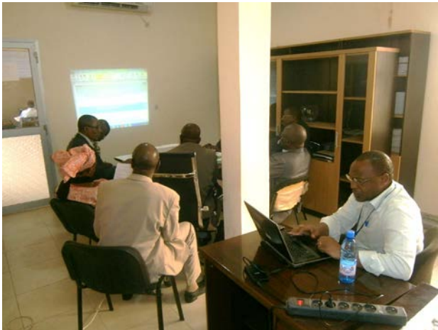
Vue des travaux en groupe de l'atelier sur le renforcement du système de santé.