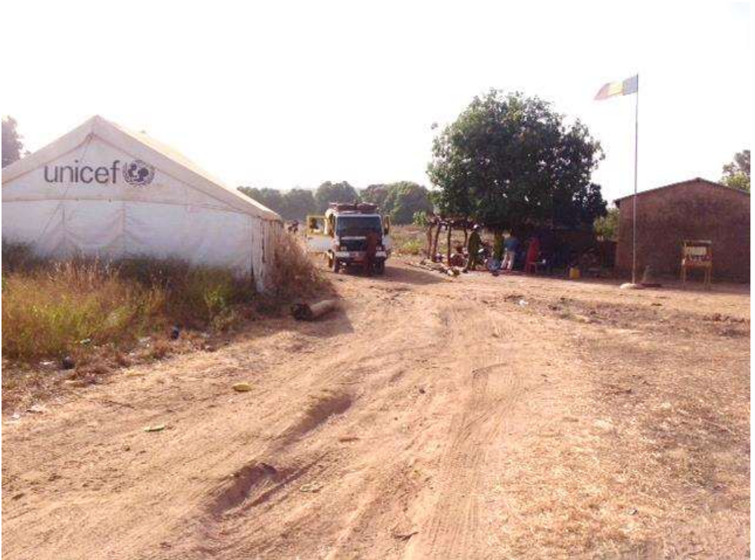
Cordon sanitaire et site d'observation de Fingouana dans le district sanitaire de Sélingué à la frontière Mali-Guinée lors de la supervision conjointe COU-OMS.